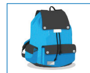
Tomar la mochila