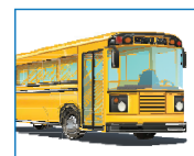
Ir al autobús